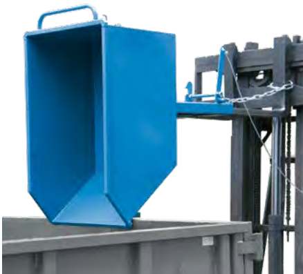
Kippbehälter als Abfallbehälter mit Gabelstapler.