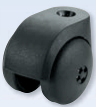
Klemmzapfen Ø 10 mm

Polyamid Doppelräder mit Gleitlager. Wahlweise mit harter oder weicher Lauffläche.